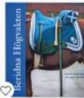
Bok - Beridna Högvakten