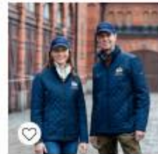
Quiltad Jacka Herr