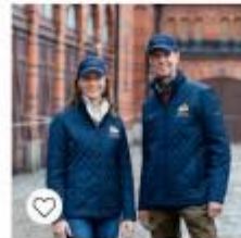
Quiltad Jacka Dam