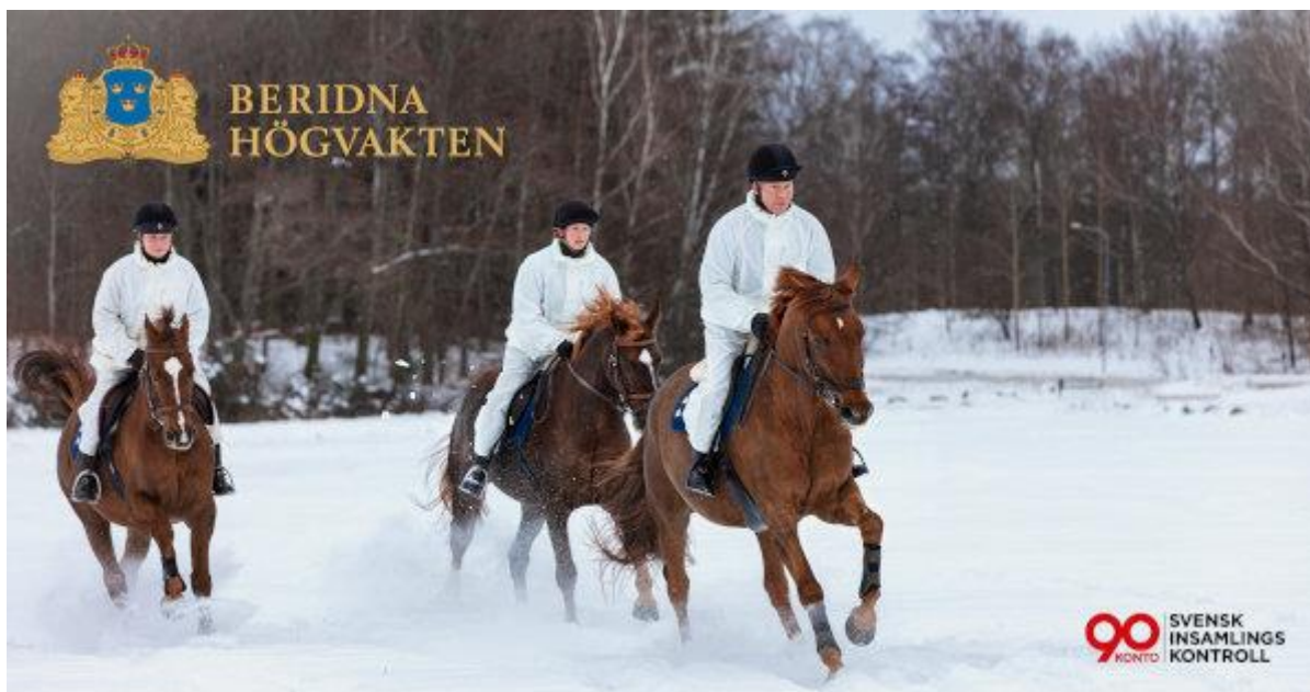
Hästarna heter Tom Morris, Af Fenix och Volt.