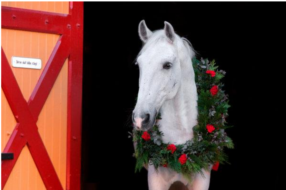
Hästen heter Daněk.