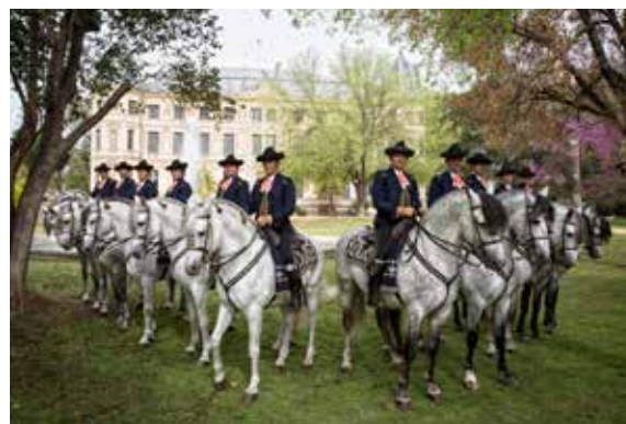
Kadrilji i slottsparken vid den Kungliga Andalusiska Ridskolan.

Vi reserverar oss för eventuella prishöjningar och ändringar i programmet som vi inte kan påverka.