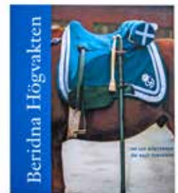
Boken Beridna Högvakten av Jan Mårtenson, 195 kr Finns även på engelska.