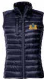
Lätt vadderad väst, dam och herrstorlek, 749 kr