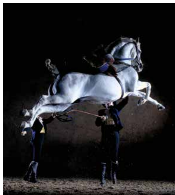
Skolan över marken; en fulländad klassisk capriole, utförd vid hand.

Njut av filmen från uppvisningen vid den Kungliga Andalusiska Ridskolan till specialkomponerad musik.