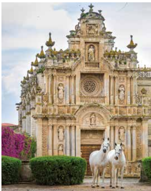
Yeguada de la Cartuja – världsledande stuteri med uppfödning av kartusierhästen.

Om du/ni vill boka till avbeställningsskydd går det bra att göra det vid anmälan till resan. Det kostar 6,25% av resans pris. Skriv bara i mailet eller tala om det vid telefonsamtalet så ordnar vi det. Observera att vi då även behöver uppgift om de sex första siffrorna i personnumret.