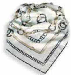
Tryckt scarf i 100% silke twill. Mått 90 × 90 cm. Ligger förpackad i presentkuvert, 950 kr