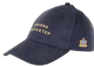
Mörkblå keps med Beridna Högvaktens emblem i guldbrodyr. Reglerbar storlek, 275 kr