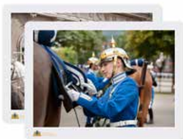
Nyhet: 2-pack bordstabletter, 300 kr, 6-pack glasunderlägg, 320 kr Levereras i elegant presentförpackning.