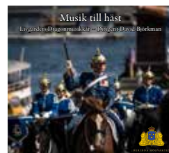
CD-skiva Musik till häst , 150 kr