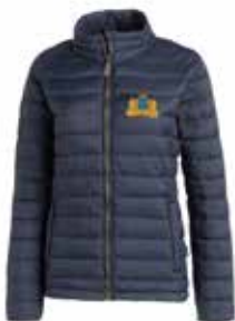
Lätt quiltad jacka, dam och herrstorlek, 849 kr

Vävd slips i 100% silke. Beridna Högvakten logo i foder. Bredd 8 cm. Ligger förpackad i presentkuvert, 610 kr